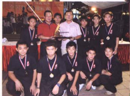
传统南狮冠军：威劲体育会