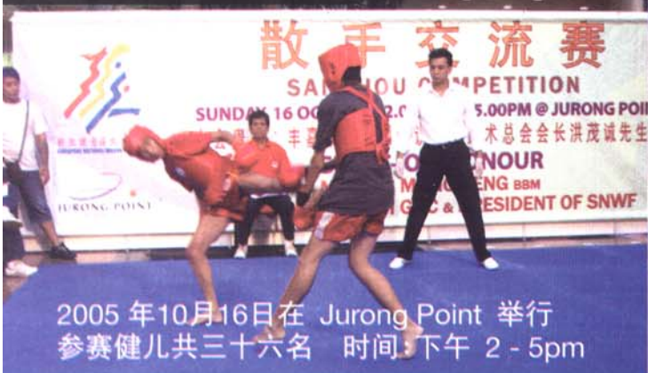
2005年10月16日在 Jurong Point 举行 参赛健儿共三十六名 时间:下午 2 - 5pm