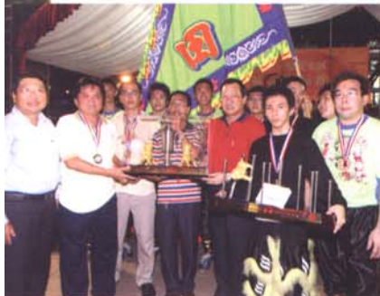
自选南狮冠军：龙田武术龙狮团