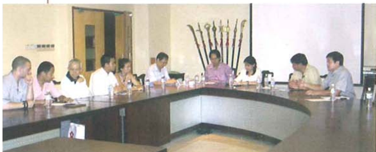
在武总会议室内接见宾客。

会议于5时正结束，武总赠送一面锦旗予来访者作为纪念，并邀请来访者参观武总会所各种练武设备。