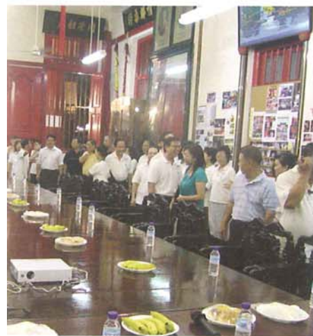
带大家进入大礼堂。