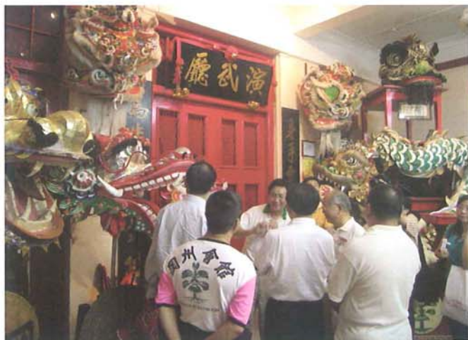
冈州三楼的演武厅收藏了许多珍贵的龙狮文物,像一所龙狮博物馆。