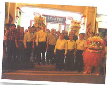
在精武门外全体合影。

太极方面也发展到陈、杨、吴、孙、武、五家都有专人开班授课。他感慨我国的体育会与会馆都面临接班人的问题，尤其会馆的现状，更使人担忧，进入会馆像进入老人院的感觉，希望武总在这方面多多培训传统武术的师资人才，让传统武术重新受到重视，让老一辈在年轻时所学的传统武术加以发扬光大，后继有人，重新让青少年认识、了解、学习传统武术的奥妙和实用价值。