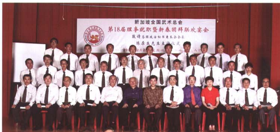
2002年第十八届全体理事就职合影

会长说,把武术运动提升为重点项目发展,是一项艰巨的任务,必须用成绩来争取,除了全体理事的通力合作和努力外,还得把培训运动员的工作做好,并要得到家长,教练以及各界人士的大力支持。会长说:武总也决定加强内部的组织和行政管理,让理事